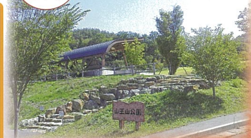
上田市わがまち魅力アップ応援事業

その他 雨天の場合は中止。小雨の時は「とっこ館」までお問い合わせ下さい。 歩きやすい服装、はき慣れた靴でご参加ください。 各ポイントでは塩田平ボランティアガイドの会の会員が説明をいたします。